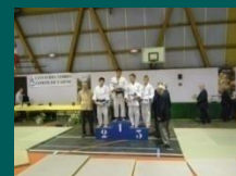
Quelques récompensés !!!