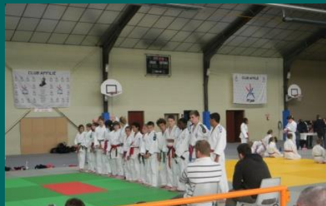
L'équipe de l'Aisne Minimes