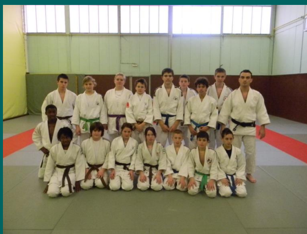
Le groupe Aisne Minimes