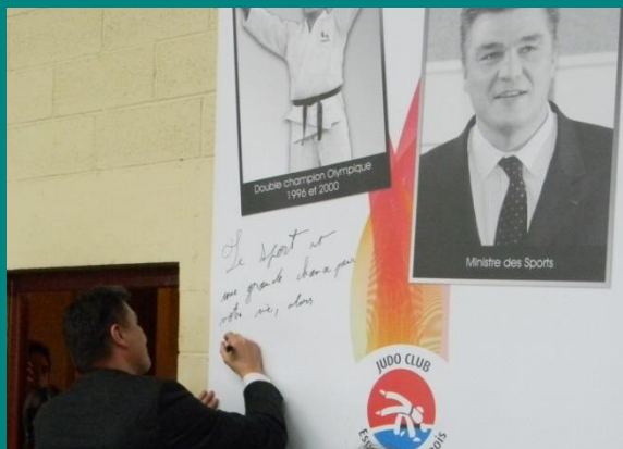
Le Ministre des Sports dédicant une affiche en son honneur