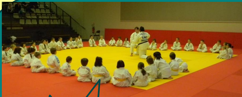
Le tapis des jeunes judokas avec Rebecca

Les champions ont tourné sur les 4 tapis afin que tout le monde en profite