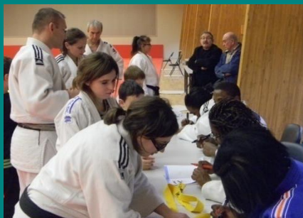
Nos champions qui ont tenu jusqu'au bout et avec le sourire pour le plus grand plaisir de tous!