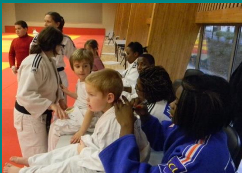
Les tee shirts, chez les plus jeunes

La file d'attente dans le plus grand calme !