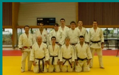
Le Jujitsu, également représenté