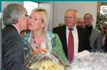
Cécile NOWAK première Française championne Olympique à Barcelone.