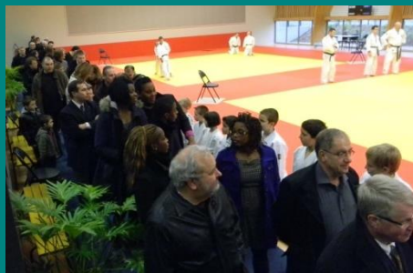
Les élus et les invités défilent devant les différents ateliers qui leur étaient proposés