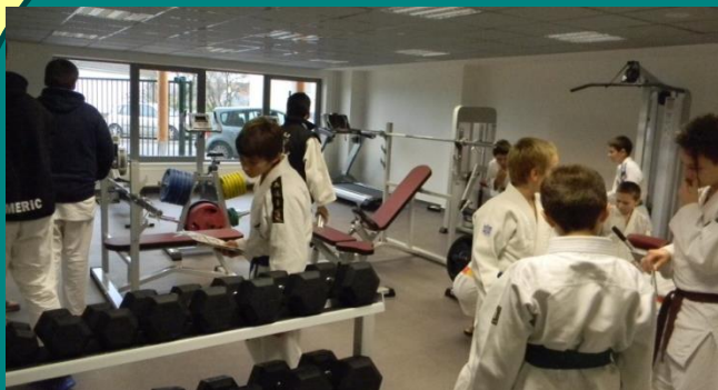
La salle de musculation : des judokas intrigués