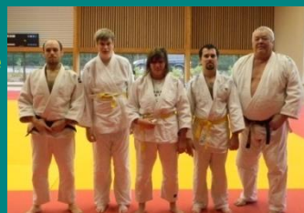
Merci aux représentants des judokas en situation de handicap d'être là pour ce grand jour !