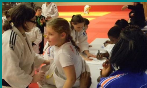
Un tee shirt qui ne devra plus être lavé.....