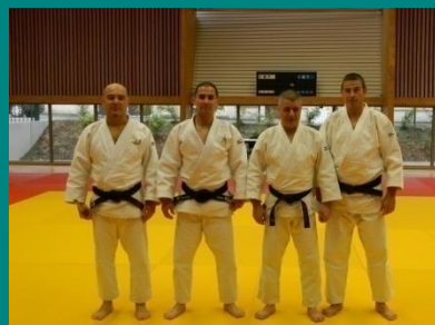
Les techniciens des Katas