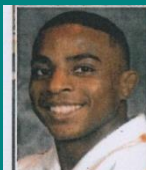
Loïc KORVAL • Champion coupe du monde d'Estonie et Roumanie • Champion de France • Vice Champion d'Europe par équipe des nations