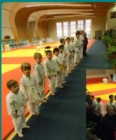
De jeunes judokas de la ceinture blanche à la ceinture noire qui étaient fiers d'être là