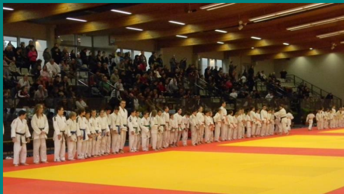
Le cérémonial d'accueil