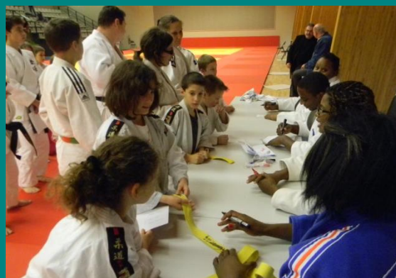
Les judogis, les ceintures.....