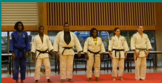
Salut final avant la séance des autographes