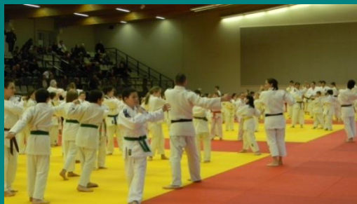
Echauffement oblige avant les conseils!