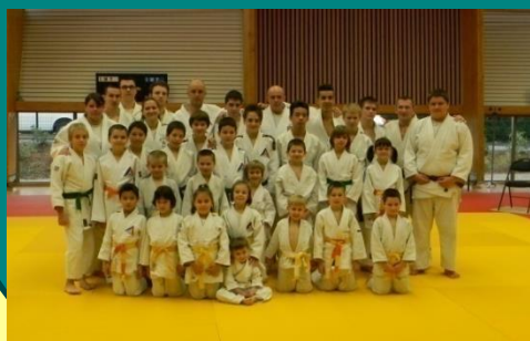
L'atelier judo toutes ceintures confondues