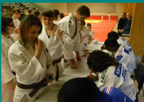
Les invitations avec photos chez les plus grands